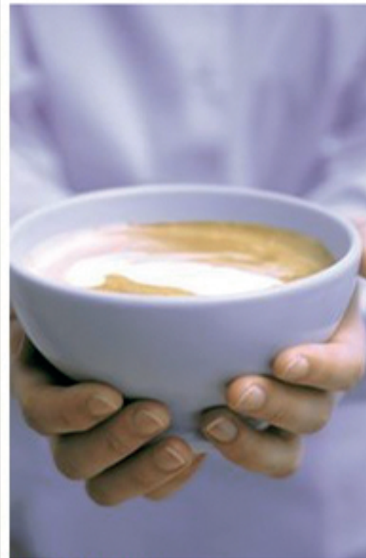
Galerie starten >> In der Milchbar werden Kaffee, Milchshakes und regionale Köstlichkeiten serviert