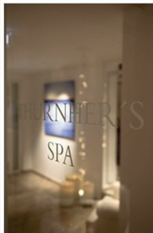
Galerie starten >> Willkommen im Spa in Thurnher's Alpenhof