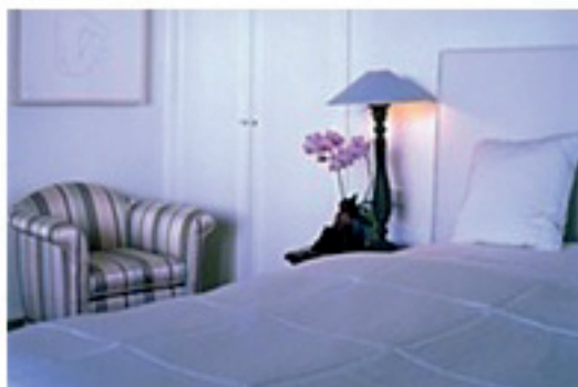
Galerie starten >> Zimmer in Thurnher's Alpenhof in Zürs am Arlberg