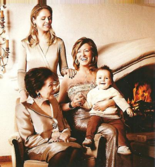
Vier Generationen geballte Frauenpower